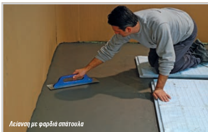
Λείανση με φαρδιά σπάτουλα