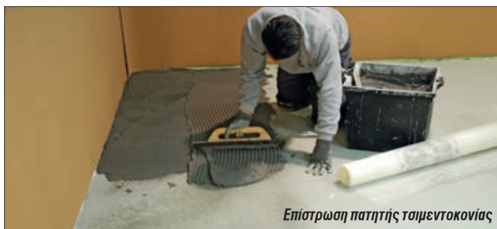
Επίστρωση πατητής τσιμεντοκονίας